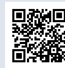
Troisième conférence et propos conclusifs